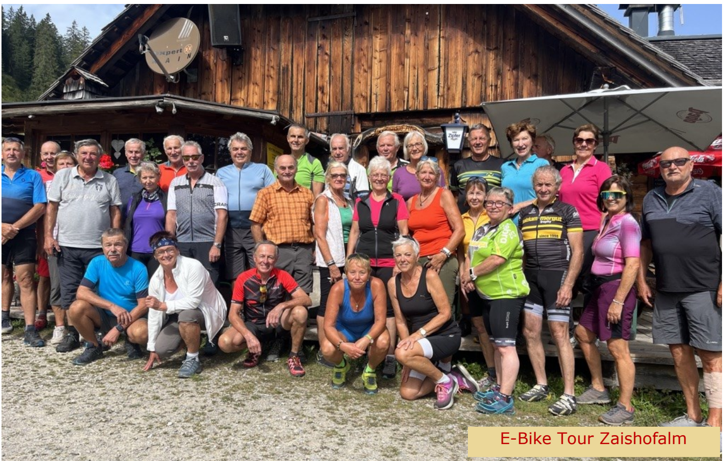
E-Bike Tour Zaishofalm

Unsere Homepage www.goiserer-pensionisten.at